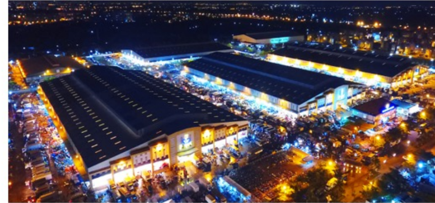
Picture: Binh Dien Wholesale Market at night