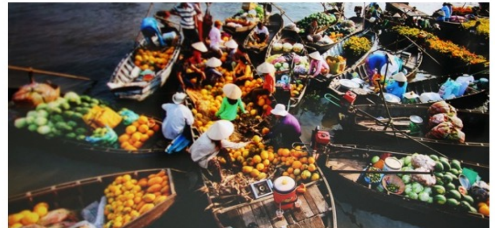
Picture: Cai Rang floating market, Can Tho province